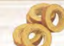
杏樹クーヘン 黒糖バームカット