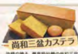
尚和三盆カステラ

バナラビーンズで香つけし、 しっとりソフトに焼き上げました。 1個 ¥1,500