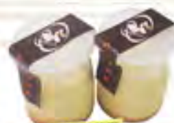
EM牛乳使用 うるくプリン

国内一の長さ! 太さ! かなぐすくロール3本分のボリューム! ※送料付き ¥3,100