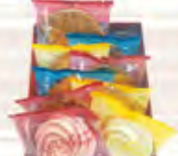
アプリコットギフトA