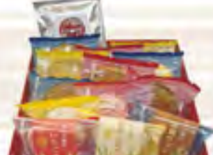
アプリコットギフトB