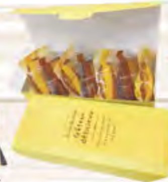
フィナンシェ詰め合わせ