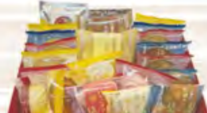
アプリコットギフトC