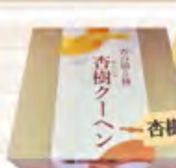
杏樹クーヘン(ソフトバーム)

バナラビーンズで香つけし、 しっとりソフトに焼き上げました。 1個 ¥1,500