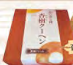
杏樹クーヘン(黒糖バーム)