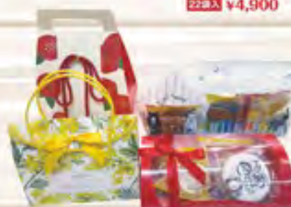
ラッピングギフト