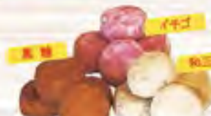
ウーじ畑のこだわりサブレ