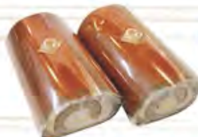
かなぐすくロール