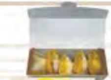
黄金レモン詰合せ