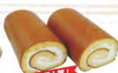
一番人気! かなぐすくロール

たっぷりの生クリームとカスタードクリームに 米粉を使用したスポンジのロールケーキ ¥1,000