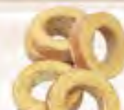
杏樹クーヘン ソフトバームカット