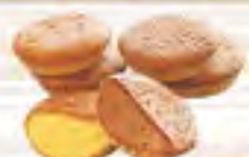
キビ糖マドレーヌ